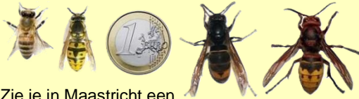
Aziatische hoornaar Europese hoornaar

Zie je in Maastricht een nest en twijfel je of het van een schadelijke Aziatische hoornaar is? Meld dit via 14 043 of de BuitenBeter app (liefst met foto) en er komt iemand langs om het nest te bekijken.