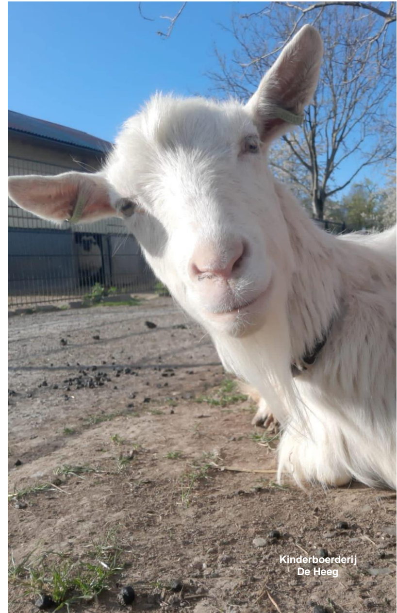
Kinderboerderij De Heeg